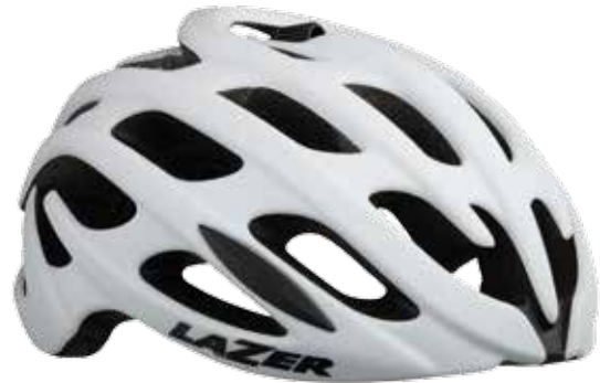
Lazer Blade / Elle