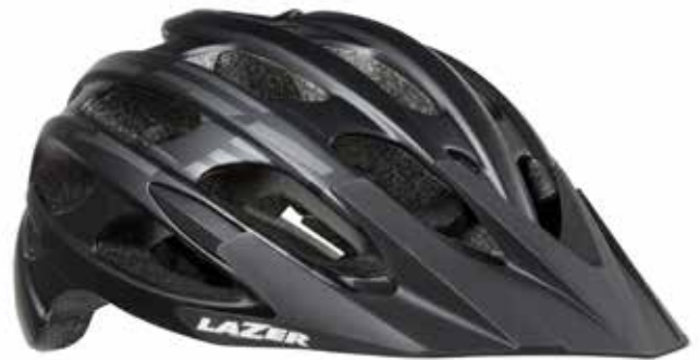
Lazer Magma / Jade

Wenn Sie einen der betroffenen Helme besitzen, setzen Sie sich bitte so schnell wie möglich mit uns in Verbindung, damit wir einen Austausch des Helms vereinbaren können. Die Ersatzhelme mit der Bezeichnung BLADE+ und MAGMA+ haben eine neue Riemenverankerung, die in Übereinstimmung mit den vorgeschriebenen Normen konstruiert ist. Sie verfügen über eine CE-Zulassung und lassen sich daran erkennen, dass ihre Artikelnummern auf „081“ oder „181“ endet.